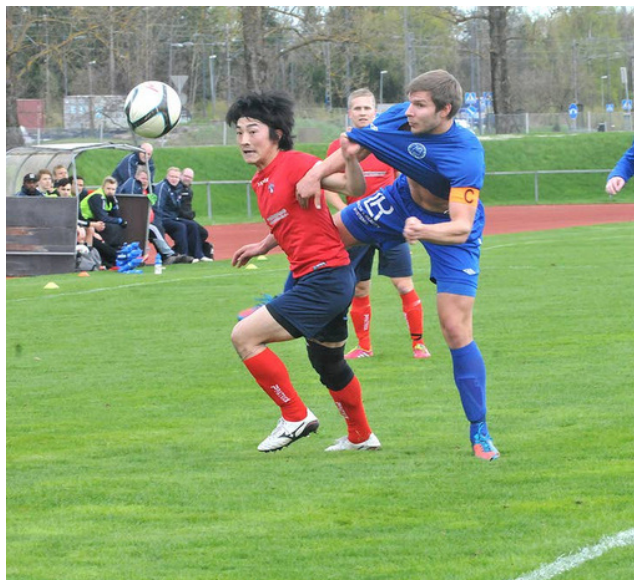
Järvenpää-päivässä – katso kuvat tapahtumasta